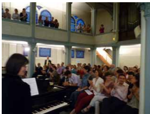
(* ) une très belle et haute salle au 1er étage d'un bâtiment inauguré en avril 1857, dû à l'architecte Valcourt

Tous frais payés, la collecte finale pour les associations reste modeste, mais cette belle soirée de plaisir musical et de rencontres chaleureuses nous donne envie de renouveler l'expérience. Nous espérons que vous serez encore plus nombreux l'année prochaine à nous soutenir de votre présence !