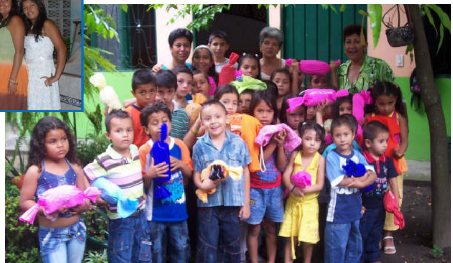
Les enfants accueillis au centre